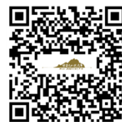
國家文化記憶庫入口網站