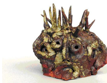
作者：酒井清 作品：人偶