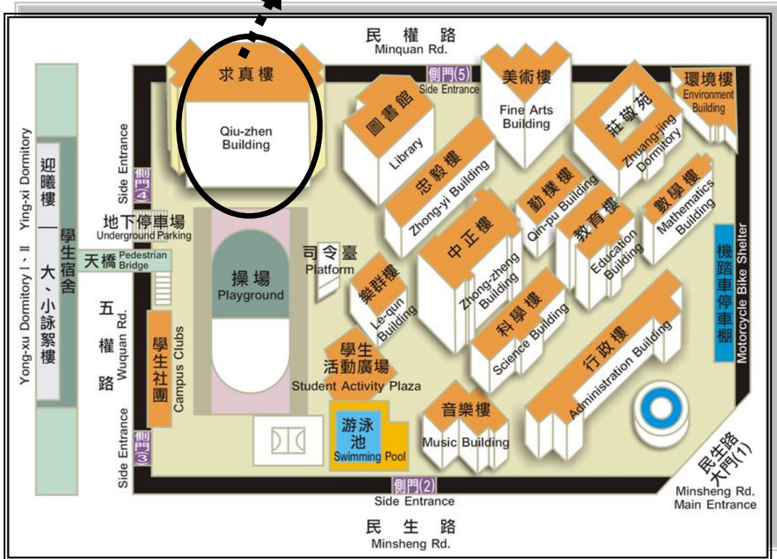
圖 1 國立臺中教育大學-校區平面圖