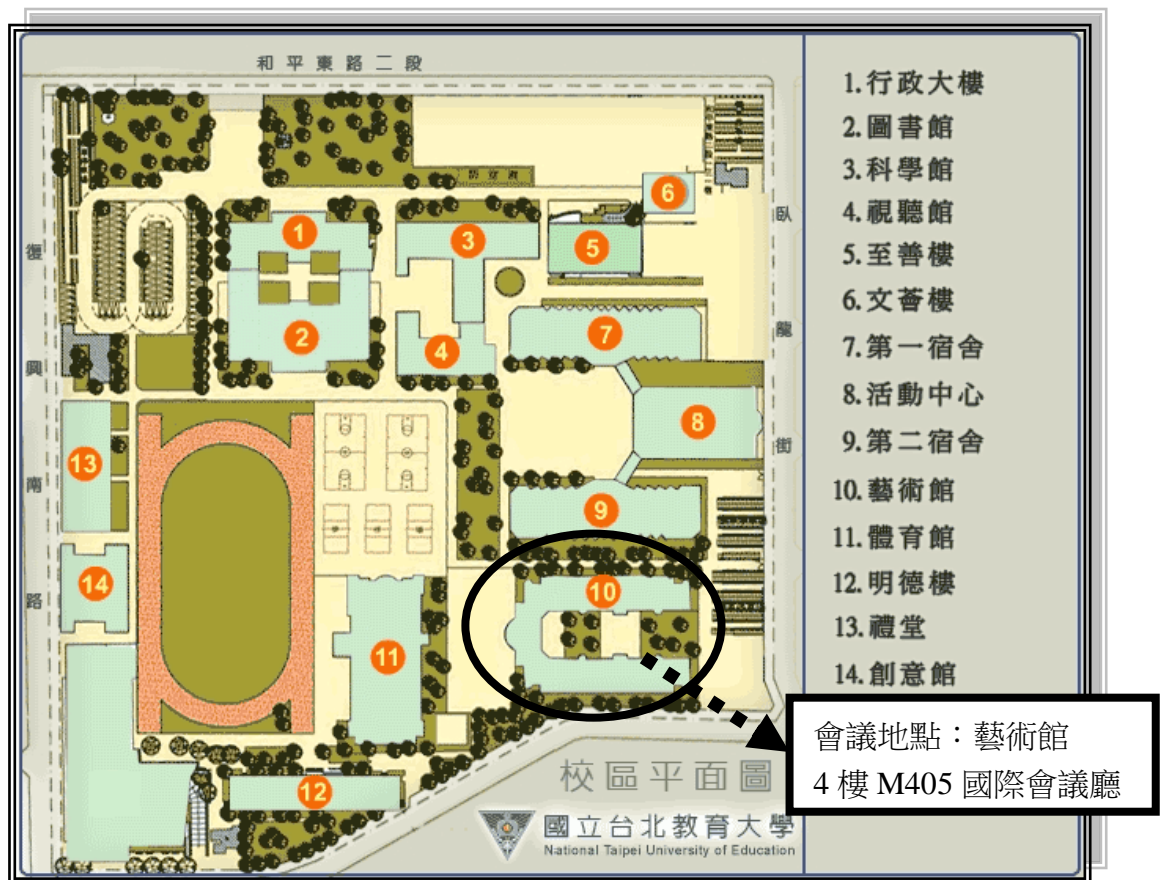
圖 8 國立臺北教育大學-校區平面圖

2. 國立臺北教育大學站-和平東路：15、15(區間車)、15(萬美線)、18、211、235、284、284(直行)、3、52、662、663、685、72、和平幹線。