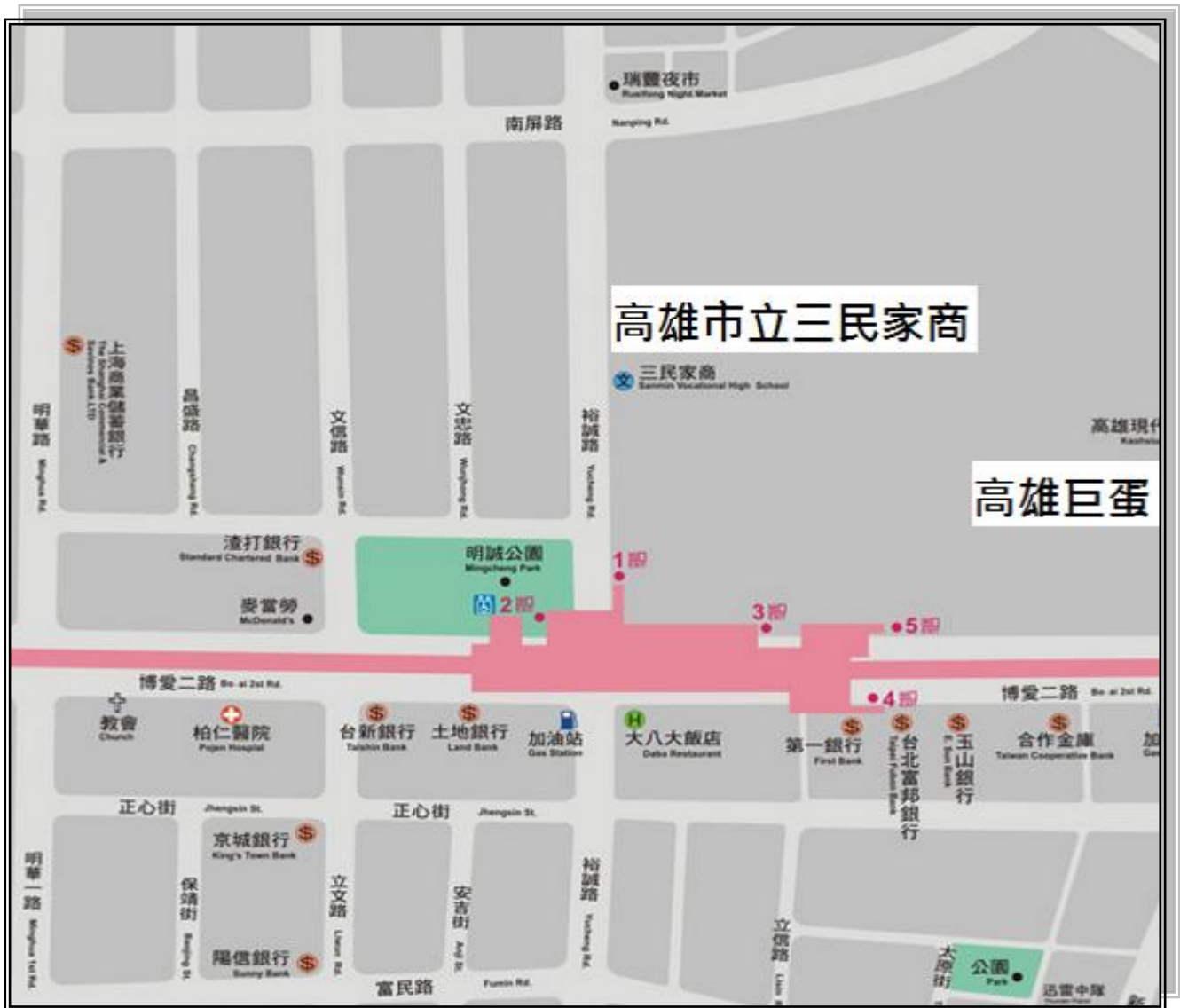
圖 4 高雄市立三民家商交通路線圖-捷運巨蛋站