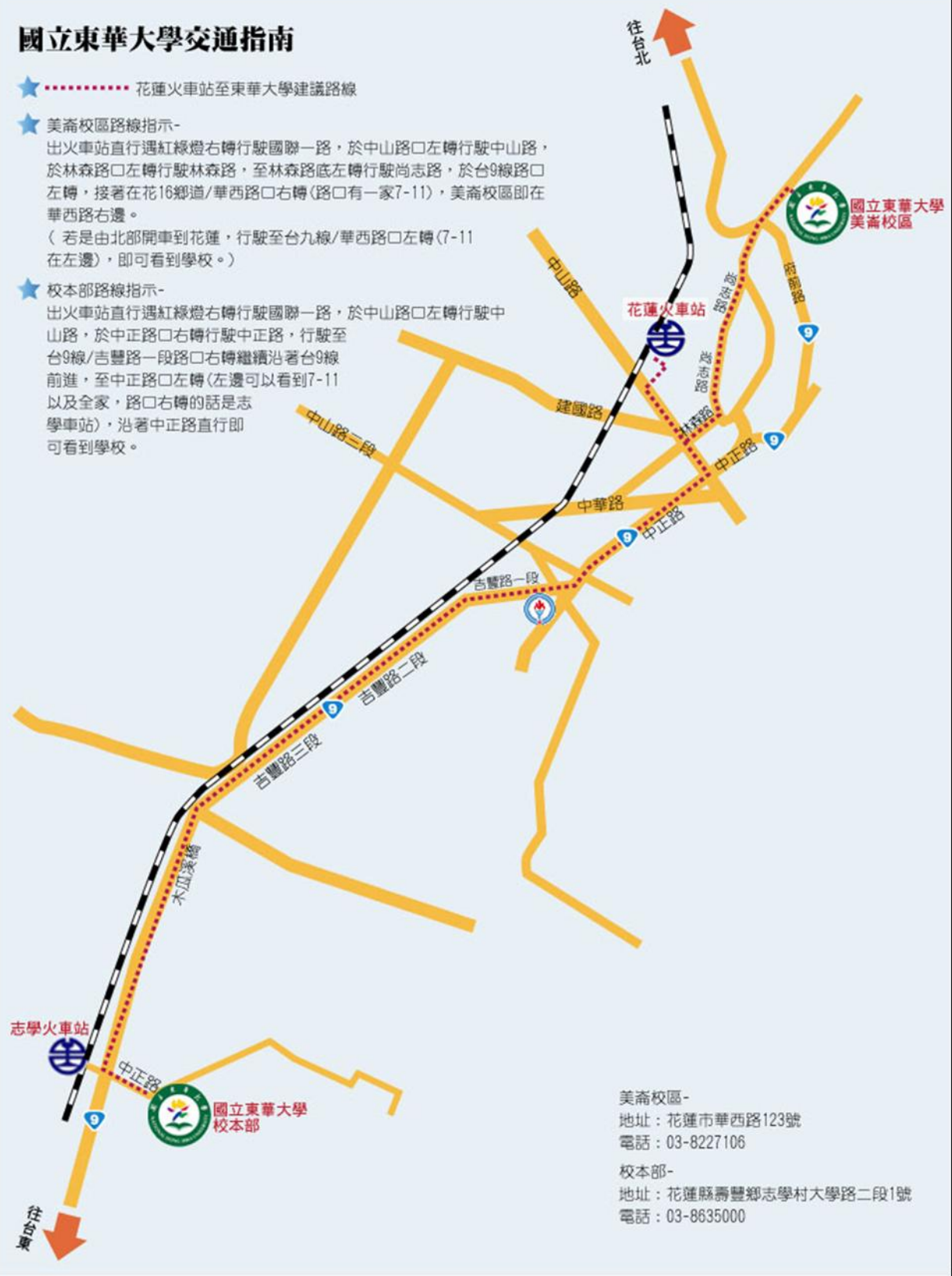
圖 7 國立東華大學美崙校區交通路線圖

出火車站直行遇紅綠燈右轉行駛國聯一路，於中山路口左轉行駛中山路，於中正路口右轉行駛中正路，行駛至台9線/吉豐路一段路口右轉繼續沿著台9線前進，至中正路口左轉(左邊可以看到7-11以及全家，路口右轉的話是志學車站)，沿著中正路直行即可看到學校。