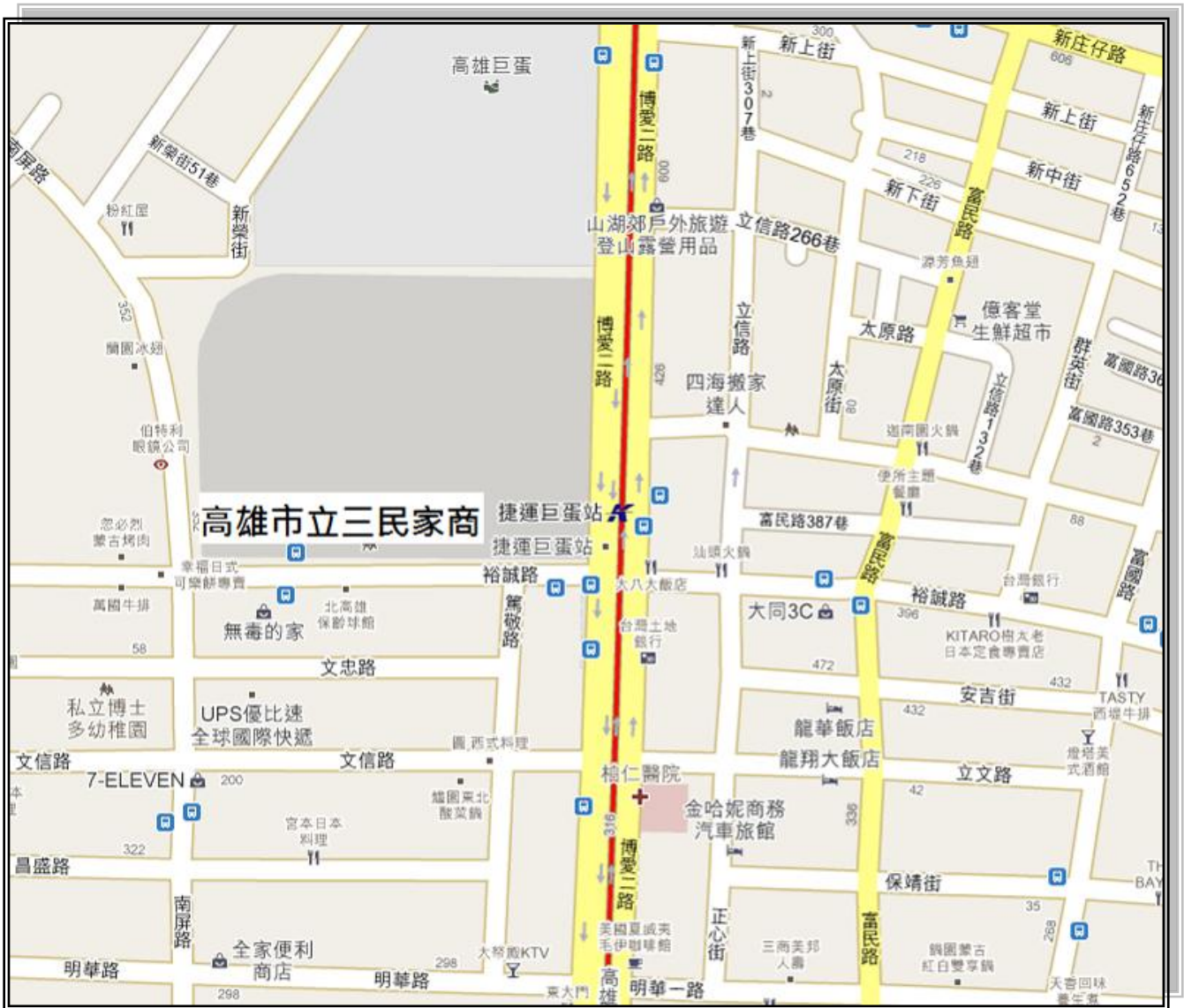
圖 5 高雄市立三民家商交通路線圖