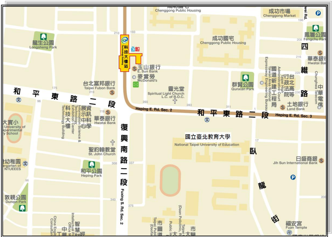
圖 9 國立臺北教育大學交通路線圖